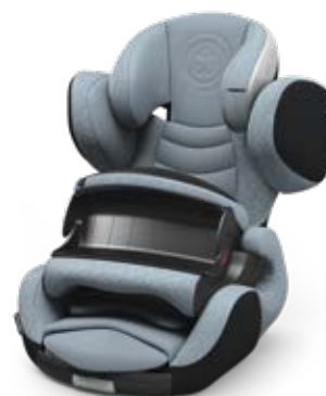
Polar Grey 41543PF125