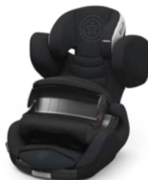
Mystic Black 41543PF123