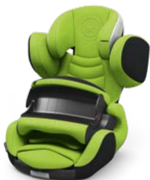
Spring Green 41543PF127

Otro aspecto a destacar es el diseño. Los puntos representan un mensaje especial en código Morse: "Kiddy. We love our kids." ¡Único e inconfundible!