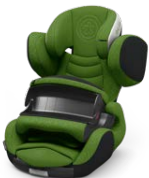
Cactus Green 41543PF122