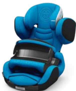
Summer Blue 41543PF121