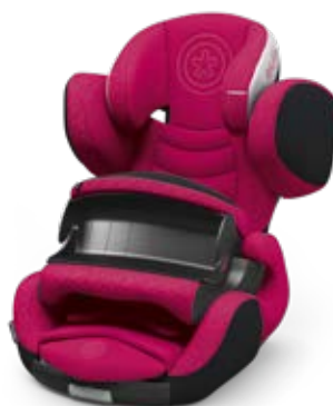
Berry Pink 41543PF120