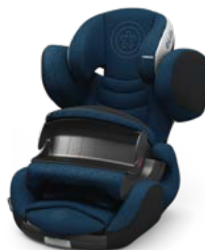
Mountain Blue 41543PF124