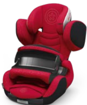
Chili Red 41543PF126