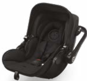
Onyx Black 41940EL060