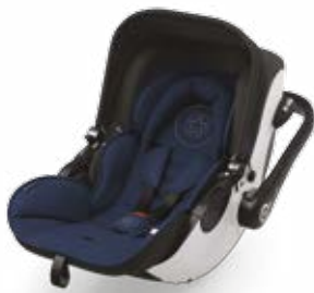
Night Blue 41940EL010

comodidad. Otro aspecto a destacar es el diseño. Los puntos representan un mensaje especial en código Morse: "Kiddy – we love our kids." ¡Único e inconfundible!