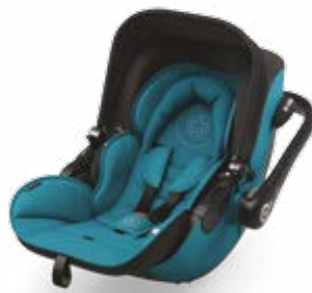
Ocean Petrol 41940EL034