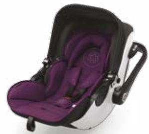
Royal Purple 41940EL040