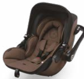
Nougat Brown 41940EL039