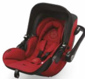
Ruby Red 41940EL071