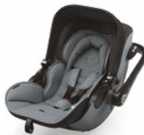
Steel Grey 41940EL076