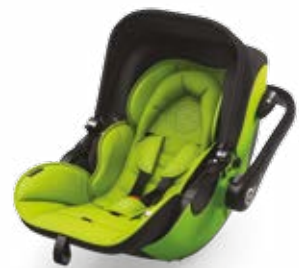
Lime Green 41940EL097